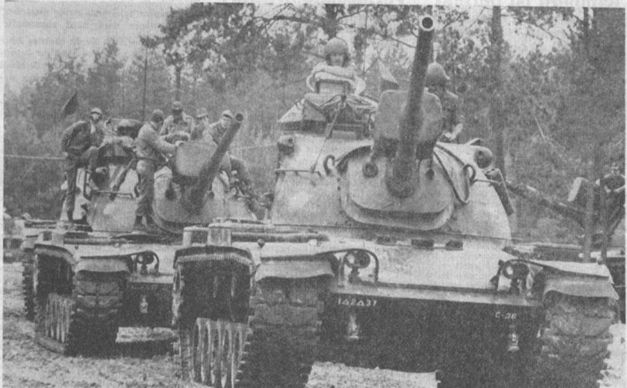
Diese Panzer vom Typ M 60 erproben in Tennenlohe im 24-Stunden-Turnus ihre leichten und schweren Maschinenwaffen.