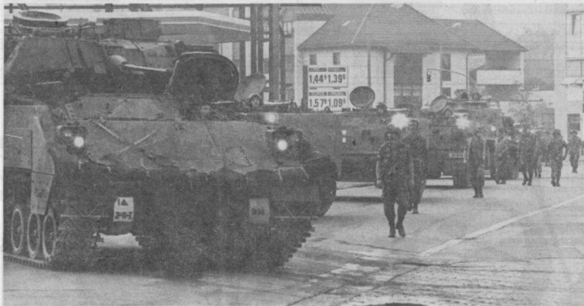
Unerträglichen Lärm verursachten die 25-Millimeter-Bordkanonen der Schützenpanzer bei Übungen in Tennenlohe.

Sollte ein Verzicht auf Schießübungen mit dem Schützenpanzer in Tennenlohe durch die vorgesetzten Dienststellen nicht genehmigt werden, so Mac Lellan und Wallace weiter, sicherten sie zu, daß künftig nach 22 Uhr mit den Bradleys nicht mehr geschossen werde.