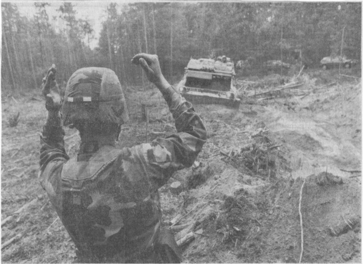
Soldaten und Panzer im Sebalder Reichswald bei Tennenlohe: Dieses Bild gehört ab Ende dieser Woche der Vergangenheit an. Was danach mit dem Übungsgelände geschieht, ist offen.