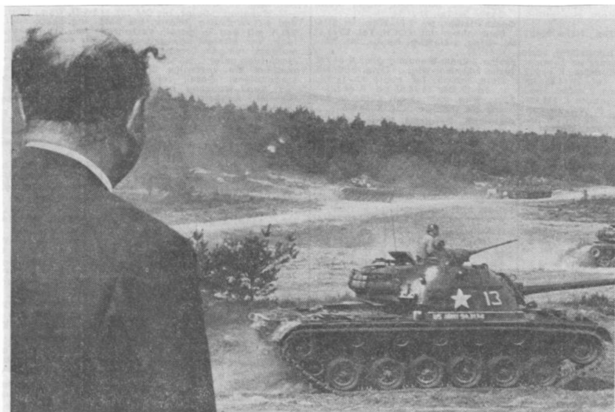
Scharf geschossen wird auf dem Truppenübungsplatz Tennenlohe. Der Beobachter links ist der Landrat des Kreises Erlangen, Heinz Beckh.