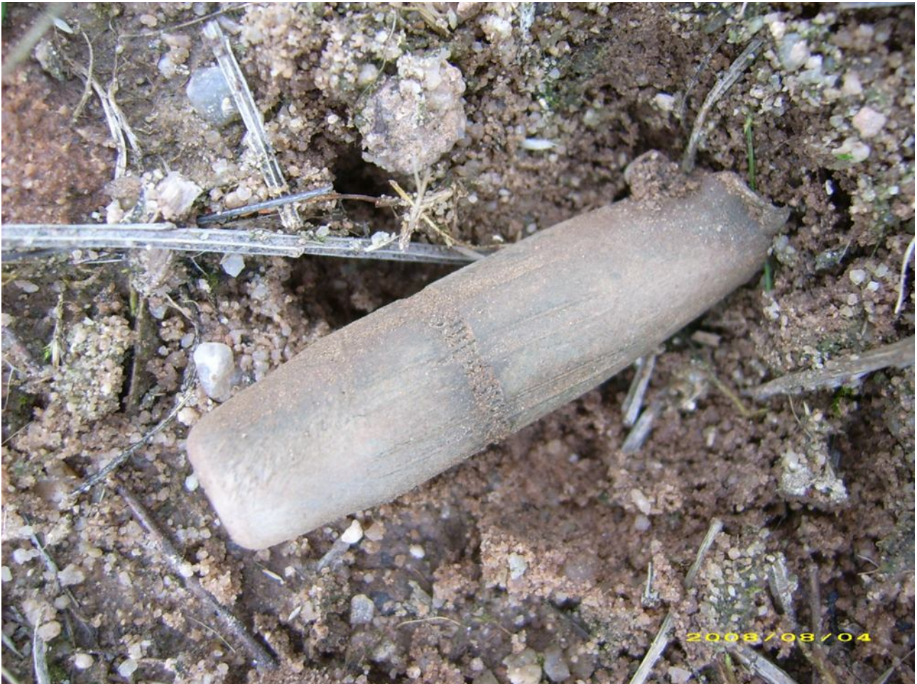
Caliber .50 Geschoss der US-Streitkräfte, wie es auf dem Areal des einstigen Übungsplatzes jahrzehntelang verschossen worden ist.

Beim Recherchieren für diesen Artikel konnte ich auch noch andere Geschichten aus der Zeit der Nutzung des Geländes durch die Amerikaner nachlesen. Trotz Verbotes trieben sich auf dem militärischen Gelände immer wieder Personen herum. Dabei geschah es auch, dass diese in Übungen der Soldaten gerieten. So schrieb ein Mann in einem Beitrag in einem Internetforum, dass er in den siebziger Jahren mit Freunden auf dem Platz herumgeschlichen sei. Dabei sei man in die Schießübungen der Amerikaner geraten, die zu schießen begannen. So blieb den Kindern nichts anderes übrig auf dem Bauch liegend in Deckung zu bleiben, bis das Schießen beendet war. Früher konnte man in den Wäldern von Tennenlohe volle MG-Gurte mit Leuchtschmuckmunition liegen sehen, so der Mann.