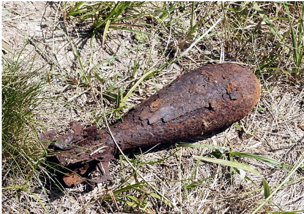
Werfergranate in stark verrostetem Zustand.