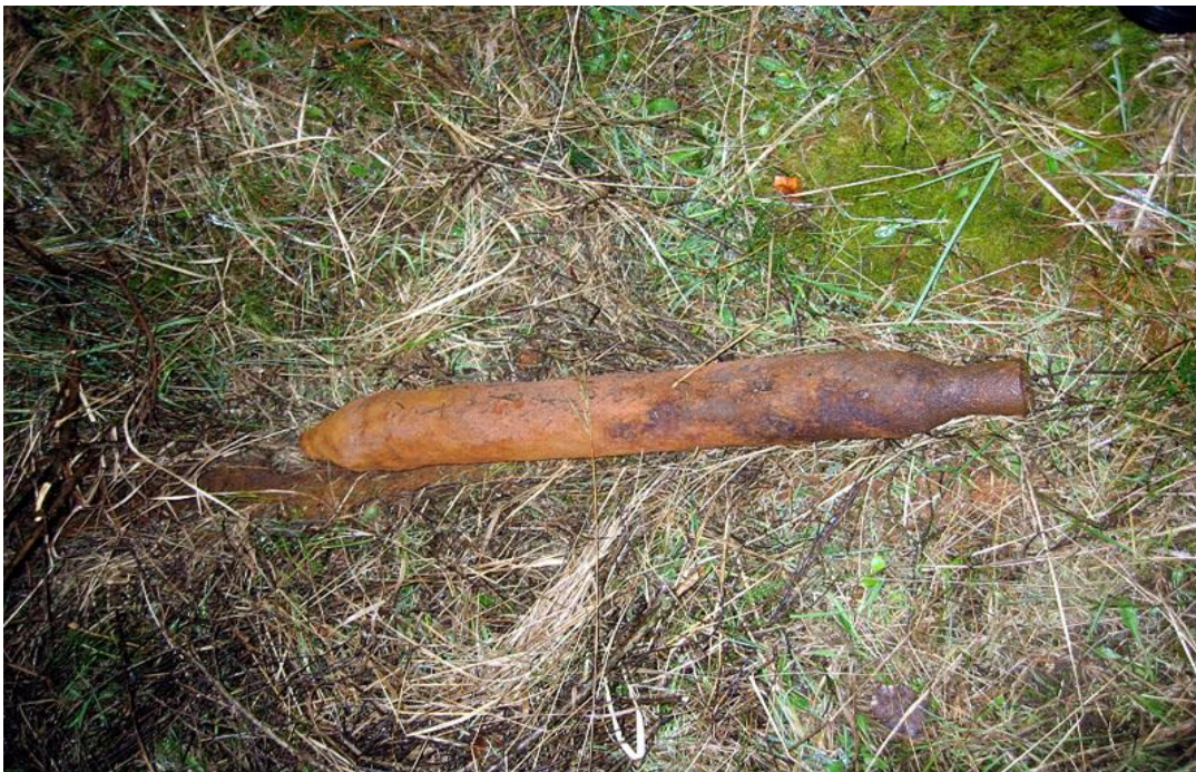
Hier zu sehen eine amerikanische Luft – Boden Rakete ohne Stabilisierungsflossen

Nachfolgend einige Bilder von Munition, die bei der Absuche und Sondierung der Zauntrasse des Wildpferdegeheges aufgefunden wurde. Nach Auskunft von Herrn Diplombiologen Johannes Marabini von der Unteren Naturschutzbehörde des Landkreises Erlangen-Höchstadt, der mit der Betreuung des Gebietes betraut ist, wurden alleine bei der Suche nach alten Kampfmitteln für die neue erweiterte Zauntrasse des Wildpferdegeheges 150 Stück Sprengmunition gefunden. Die Funde bestanden aus Werfergranaten und hochgefährlichen Flakgranaten, die mit Zeitzündern versehen waren. Aber auch amerikanische Luft-Boden Raketen, bei denen allerdings die Stabilisierungsflächen fehlten, wurden aufgefunden. Einige dieser hochexplosiven Kampfmittel wurden unmittelbar neben bestehenden Trampelpfaden im Gelände des Naturschutzgebietes geborgen. Diese alten Kampfmittel stammten sowohl aus Beständen der Wehrmacht wie auch von den Amerikanern.