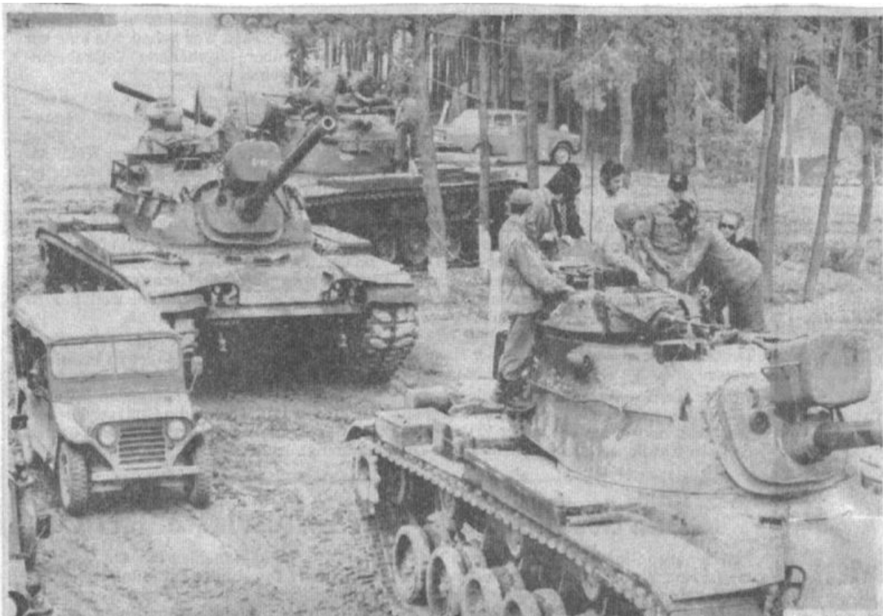
Ein Ärgnis für die Nürnberger, Fürther und Erlanger: der US-Schießplatz in Tennenlohe.