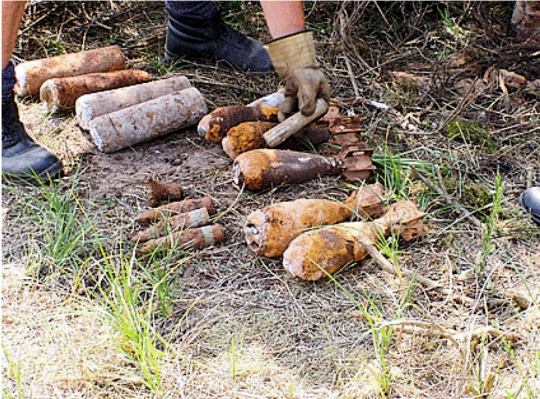
Munitionsfachpersonal beim Bergen von Funden im Naturschutzgebiet Tennenlohe. Zu sehen verschiedene Arten von Sprenggeschossen.